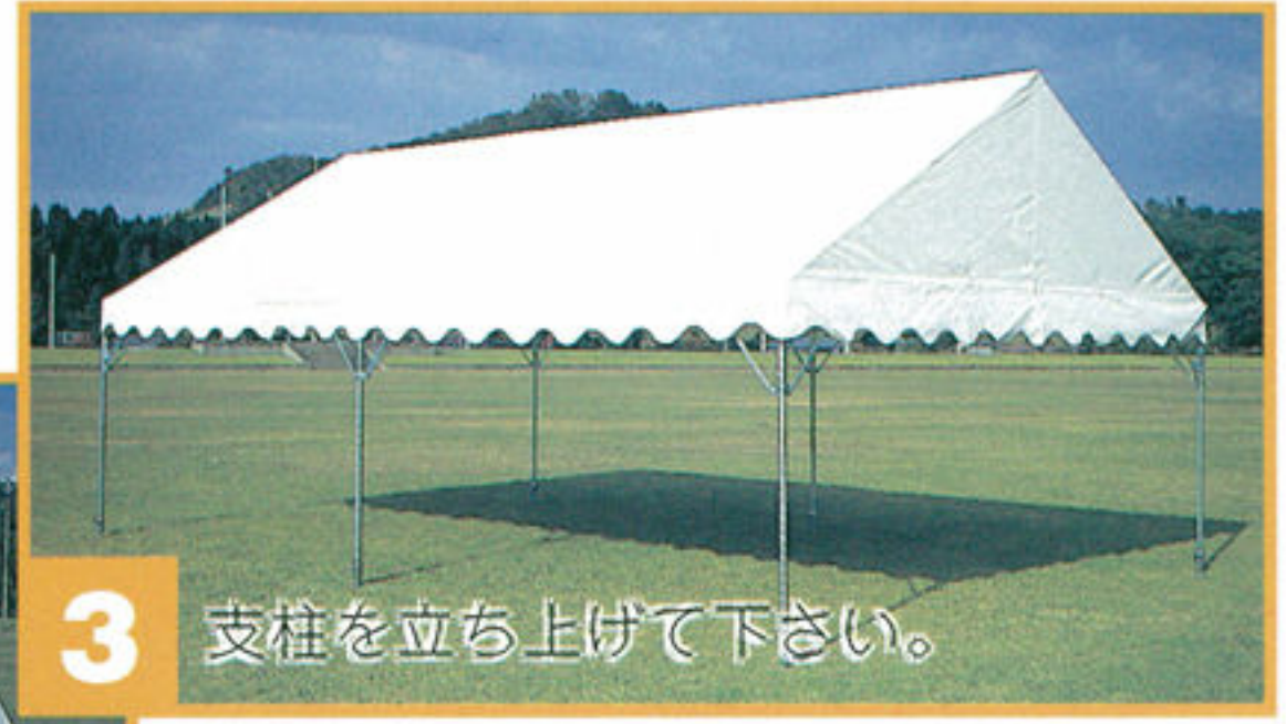
3 支柱を立ち上げて下さい。