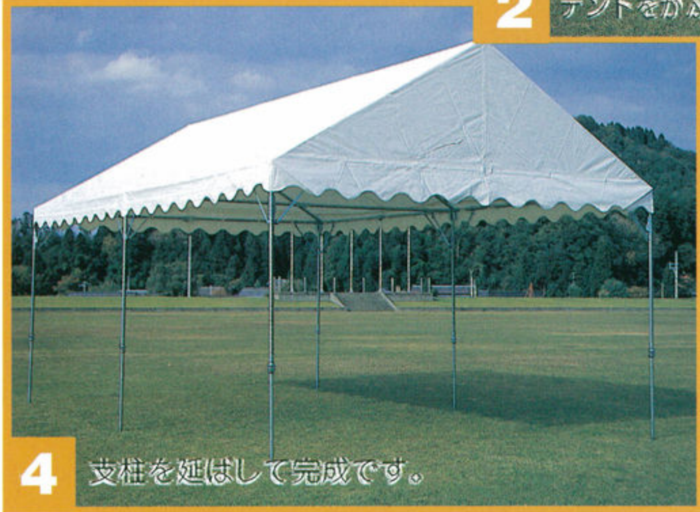
4 支柱を延ばして完成です。