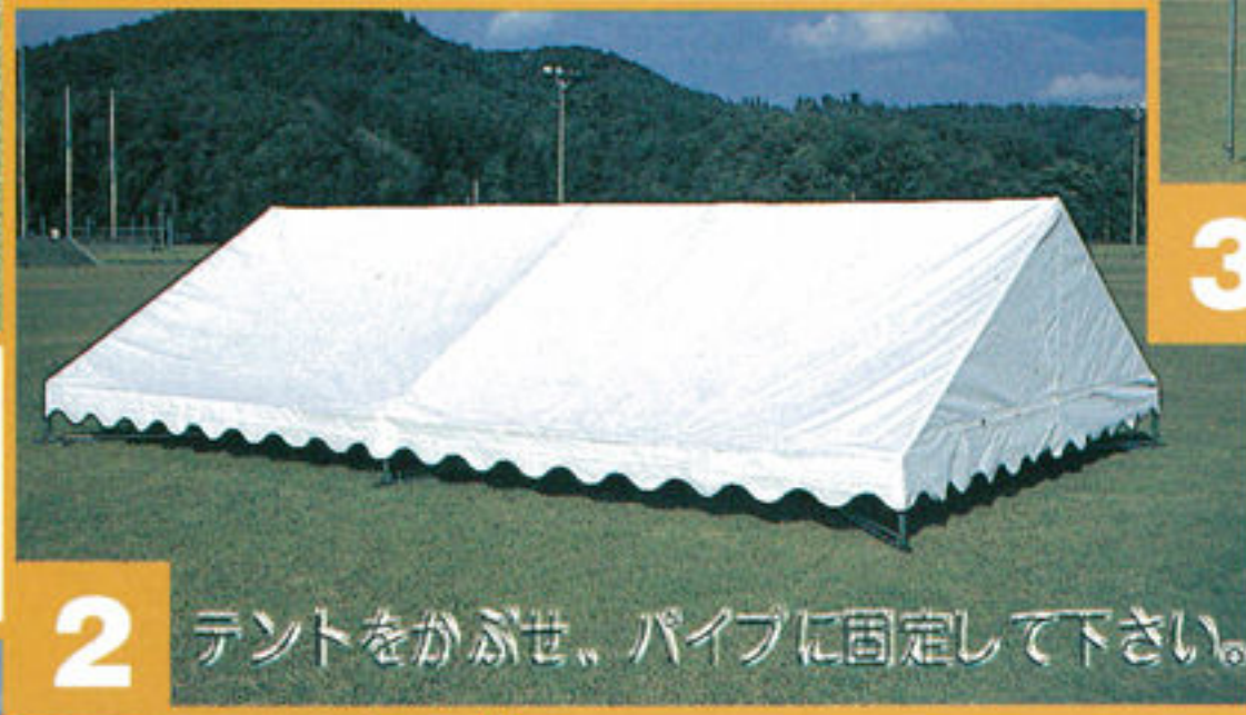
2 テントをかぶせ、パイプに固定して下さい。