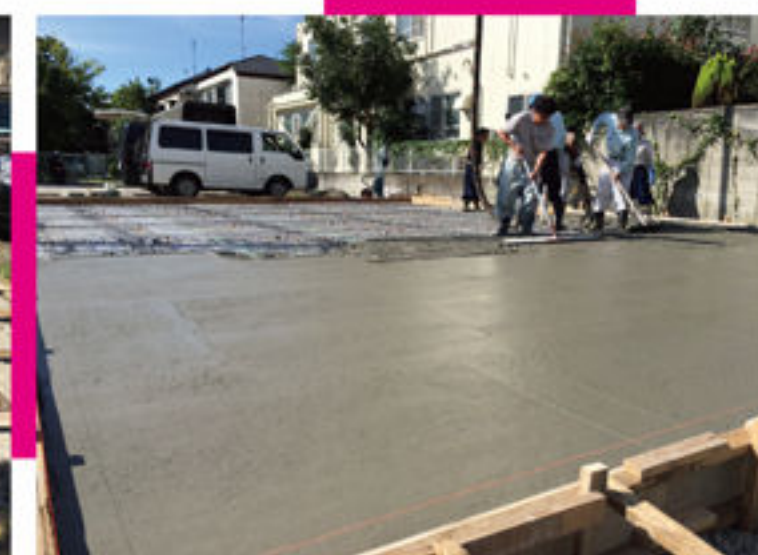
土間コンクリート